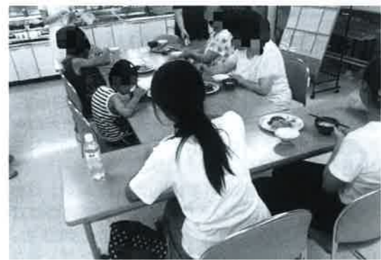
多賀城市の子ども食堂の様子

加し、宮城県でも480億円増え、逆に税や社会保障の負担額は全国で1.1兆円減り、宮城県でも171億円減少するとしている。 り、生活困窮者の早期発見による公的支援へのつなぎ、地域のコミュニティづくりにもつなげたい考えで、NPO法人などへの委託を予定し、立ち上げに向けての講習会や講座の開催を行うとしている。県が3月時点で把握している子ども食堂は、仙台、石巻、多賀城、塩釜市に計15カ所。開催の頻度や食事を有料にするかどうかは運営者が決めている。県では「もっと増やしていきたい」という。